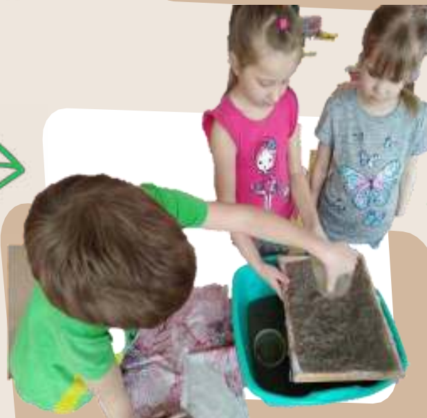
Связка волокон и первичное обезвоживание