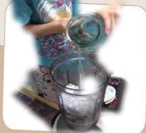
Роспуск макулатуры до целлюлозного волокна