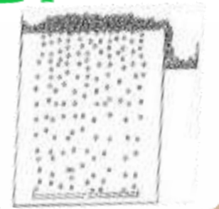
Очистка от краски и клейких веществ