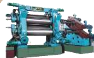
Уплотнение бумаги, придание гладкости и глянца