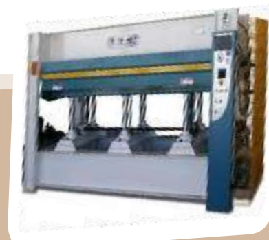
Скрепление волокон под горячим прессом