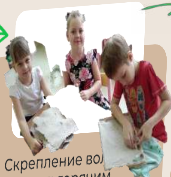
Скрепление во под горячим прессом