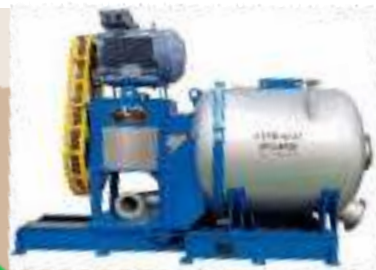
Еще большее измельчение бумаги и очистение от примесей