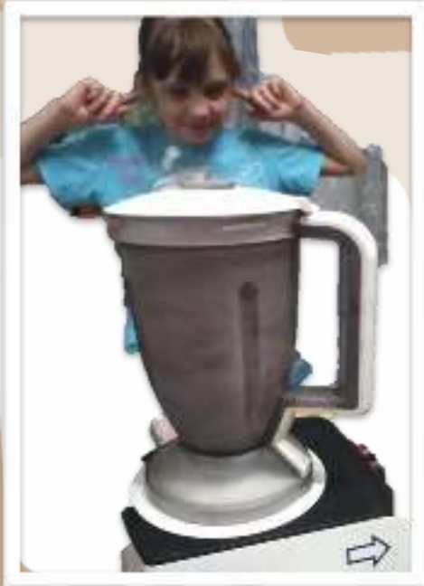
Еще большее измельчение бумаги и очистение от примесей