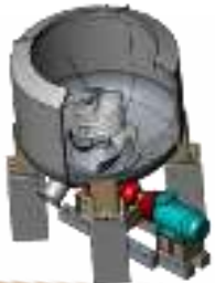
Роспуск макулатуры до целлюлозного волокна