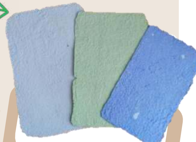
Уплотнение бумаги, придание гладкости и глянца